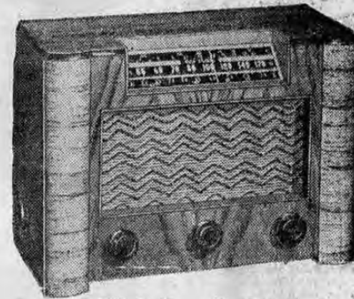
MODEL Q14 No. X-1852

He aquí un modelo con cualidades de funcionamiento que son extraordinarias entre los instrumentos de precio bajo. Por su sensibilidad y selectividad... por su estilo esmerado y por la alta calidad del mueble... representa un valor máximo.